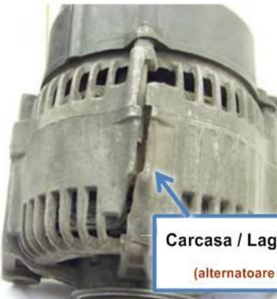
Carcasa / Lagar de antrenare spart (alternatoare DENSO/ Magneti Marelli)