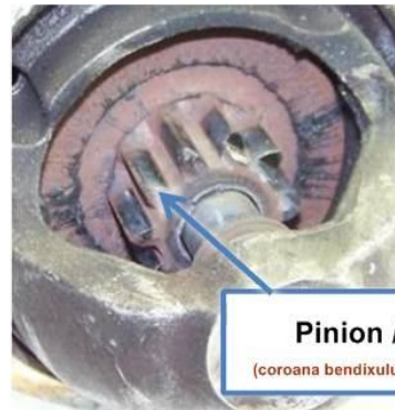
Pinion / Bendix uzat (coroana bendixului are urme de cuplare inversa)